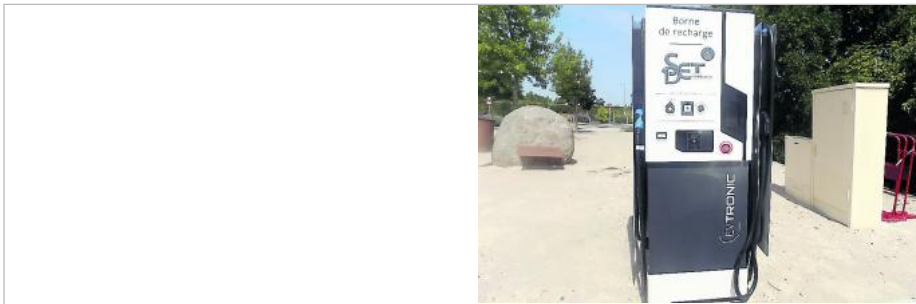
La borne IRVE a été installée route de Castres.

Ces derniers mois, la commune s'est dotée de nouveaux équipements. Une borne d'infrastructure de recharge pour véhicules électriques (IRVE) version recharge rapide est installée à l'entrée du village, route de Castres. Mise en place dans le cadre d'un partenariat entre le Syndicat départemental d'énergies du Tarn (SDET) et la mairie de Soual, cette infrastructure permet aux propriétaires de véhicules électriques de les recharger. Une aire de stationnement réservée aux utilisateurs et des aménagements ont été créés.