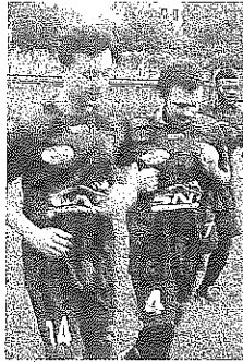
Du beau spectacle à ne pas manquer le 9 août !