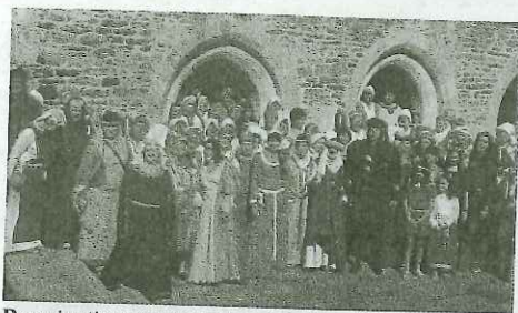
Des animations pour toutes les générations.

Joutes médiévales, calligraphie, défilé de mode médiéval, création d'instruments de musique avec la troupe Zinga Zanga... c'est une programmation riche et variée qui sera proposée aux visiteurs qui feront une halte à la quatrième édition de la fête médiévale de Burlats le 25 août prochain. Les festivités débiteront à partir de 10 h par l'ouverture du marché et du campement médiéval et la présentation de la cour des Trencavel. Sur l'île, artisans calligraphes, démonstration de tissage galon, de broderie ou de reliure permettront à toutes les générations de plonger dans les savoir-faire traditionnels au temps des chevaliers. Pour les enfants, des jeux médiévaux enfants (catapulte à bonbons, parcours du chevalier, présentation d'armement...) seront animés par les membres des troupes des Chevaliers et Gentes dames d'Occitanie, Historia Tolosana, les Seigneurs d'Hautpoul et la Maisnie des Loups de l'Arn. En fin d'après midi, le chœur du moulin des Sittelles présentera son spectacle Hildegard de Burlats. Un spectacle qui sera suivi d'un apéritif offert par la municipalité et un banquet médiéval. Pour le banquet réservation au 06 70 99 98 84.