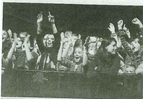
Le public sera au rendez-vous pour applaudir les artistes.