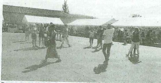
Des moments privilégiés.

Plus de 300 associations représentées, invitées régulièrement à se faire connaître afin de diffuser des informations aux futurs adhérents. Mais pour ce faire, le moment privilégié est toujours celui de la rentrée! Deux rendez-vous, deux forums, deux occasions de découvrir les activités développées sur le territoire et passer une journée ludique aux côtés des membres très actifs de ces associations! Ces deux rendez-vous, le 7 septembre à Montredon-Labessonnié et le 14 septembre à Réalmont, permettront au public de profiter de démonstrations, initiations mais aussi d'animations gratuites et de cadeaux pour les plus jeunes. Ce seront surtout des moments privilégiés pour rencontrer les bénévoles et profession-